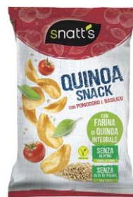
QUINOA pomodoro & basilico