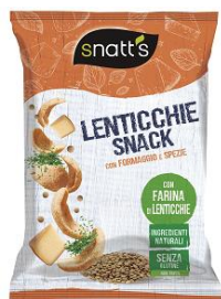
LENTICCHIE formaggio & spezie