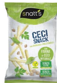
CECI basilico & prezzemolo