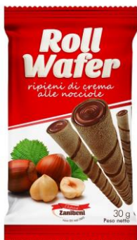
Crema di NOCCIOLA