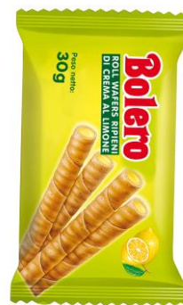
Crema di LIMONE